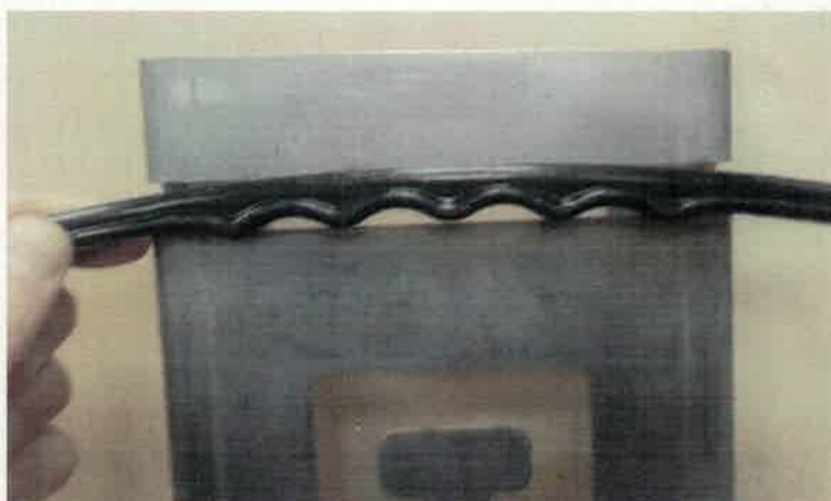
Detalle del problema para introducir el asa presentado por el licitador nº 6

Propuesta de plan de reciclaje para los contenedores rotos (máximo 5 puntos)