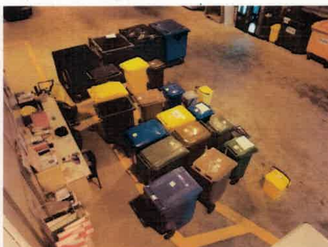
Inicio de pruebas en planta

Para realizar la valoración técnica se ha formado un grupo de trabajo compuesto por un representante de los recogedores, un coordinador de la recogida y el técnico de medioambiente de Garbitania. Las muestras presentadas por los licitadores se han estudiado una a una en la planta de Garbitania, presentando cada muestra según su correspondiente orden numerado: